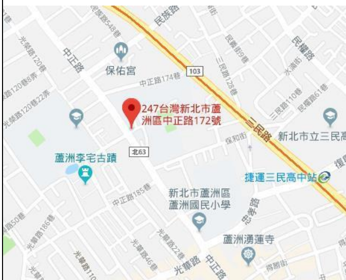
國立空中大學位置圖